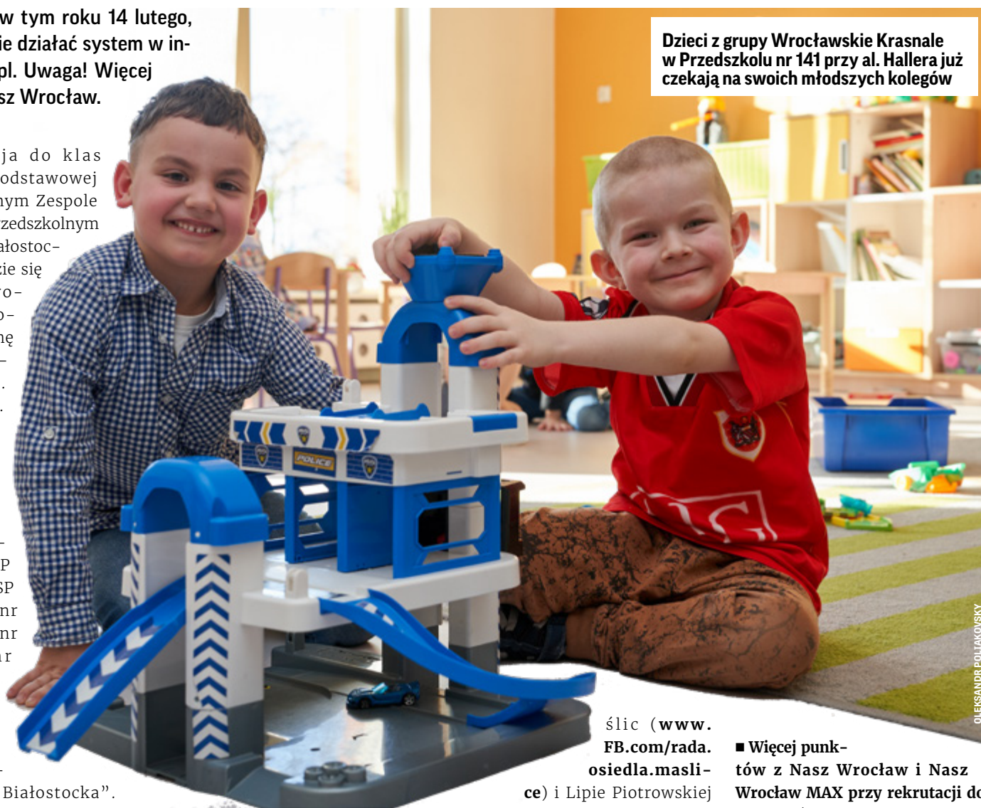
Dzieci z grupy Wrocławskie Krasnale w Przedszkolu nr 141 przy al. Hallera już czekają na swoich młodszych kolegów